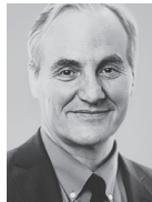
Prof. Dr. Ernst Fehr Verhaltensökonom, Universität Zürich